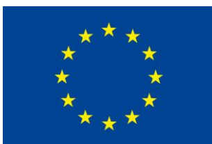
The European Agricultural Fund for Rural Development: Europe investing in rural areas

Nedan två bilder på principer, framgångsfaktorer och utmaningar är viktiga nyckelord i vårt eget arbete.